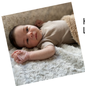
Hoani TISSIER Le 01 août 2020

Bienvenue aux bébés et félicitations aux parents