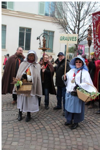
Défilé Confrérie à Epemay

La Saint-Vincent, fête traditionnelle célébrée par les vignerons de la Champagne en l'honneur de Saint-Vincent, le saint patron des vignerons.