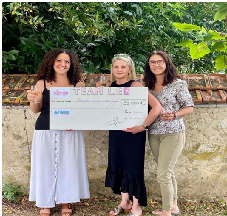
La déléguée territoriale de Vaincre la Mucoviscidose reçoit le chèque de 35 000 € de la part de la Présidente de Team Léo et de la secrétaire

Pour les déposer, RDV à la mairie ... Une boîte est à disposition dans l'entrée... (ou au 1 rue neuve à Grauves)