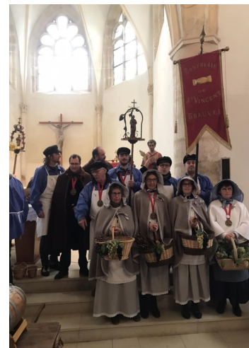
Célébration St Vincent à Chavot